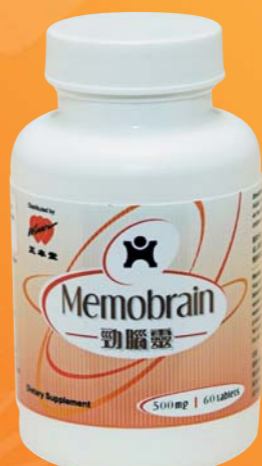
勁腦靈 老板學生冇頭痛 $228