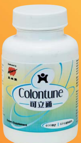
可立通 溫和排毒更輕鬆 $188