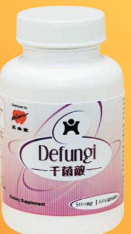
千菌敵 安全可靠抗病毒 $188