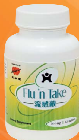
流感敵 免疫系統最佳拍檔 $188